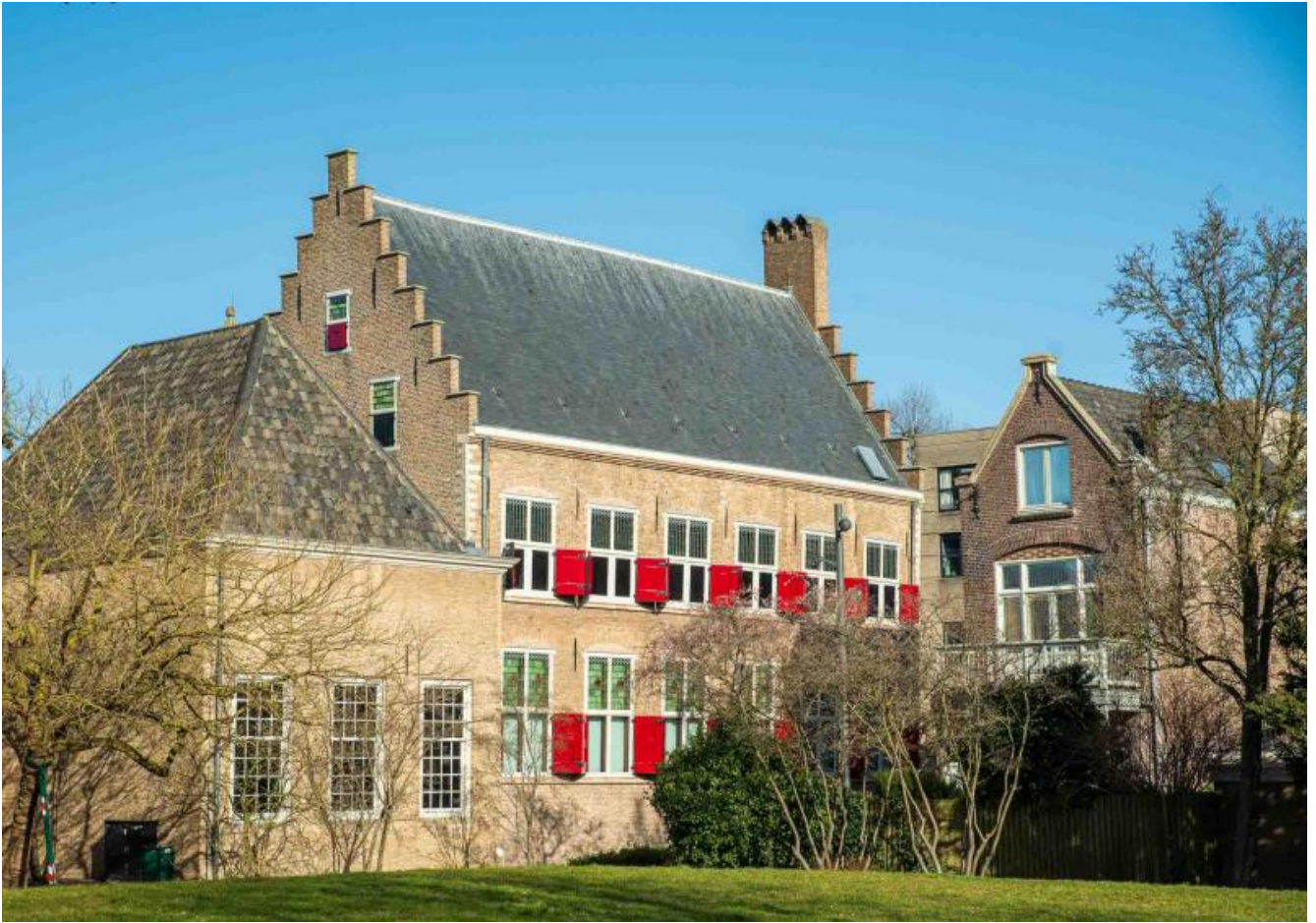
Hof van Nederland