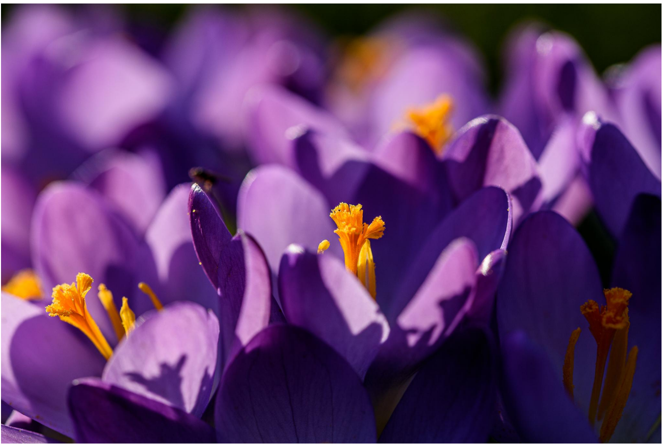
Krokussen paars erg dichtbij