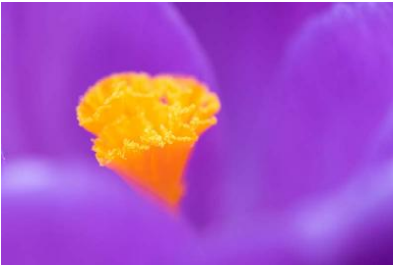
Krokus meeldraden Afbeelding