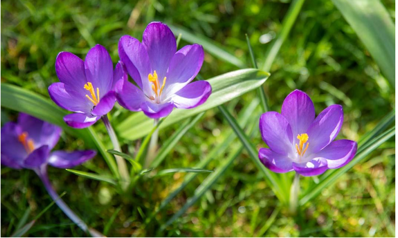
Boerenkrokus dichtbij Afbeelding