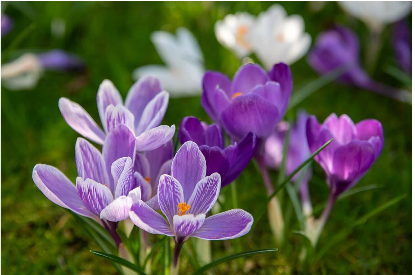
Krokus paars dichtbij Afbeelding