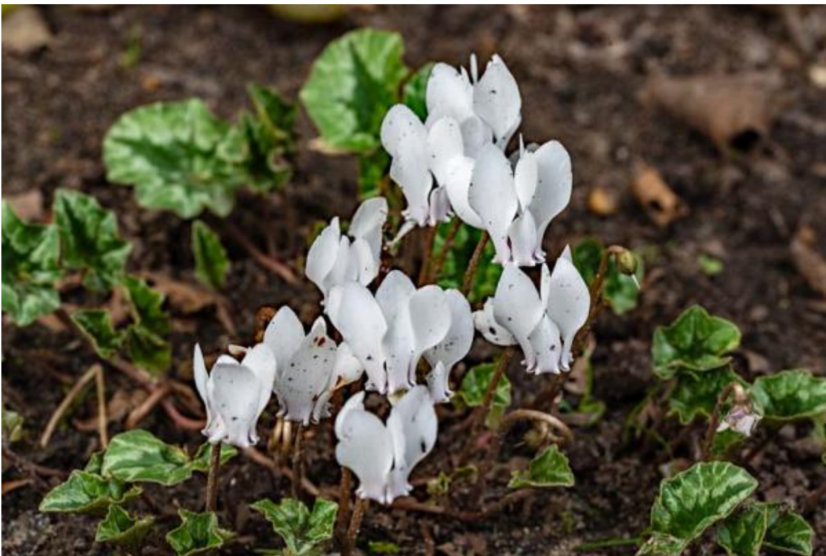
Cyclamen hederifolium 'album'

Die van ons staan in een hoekje onder een heg en dat lijkt dapper, maar op zo'n plek heb ik ze juist ook in het wild gezien in het bos in Italië.