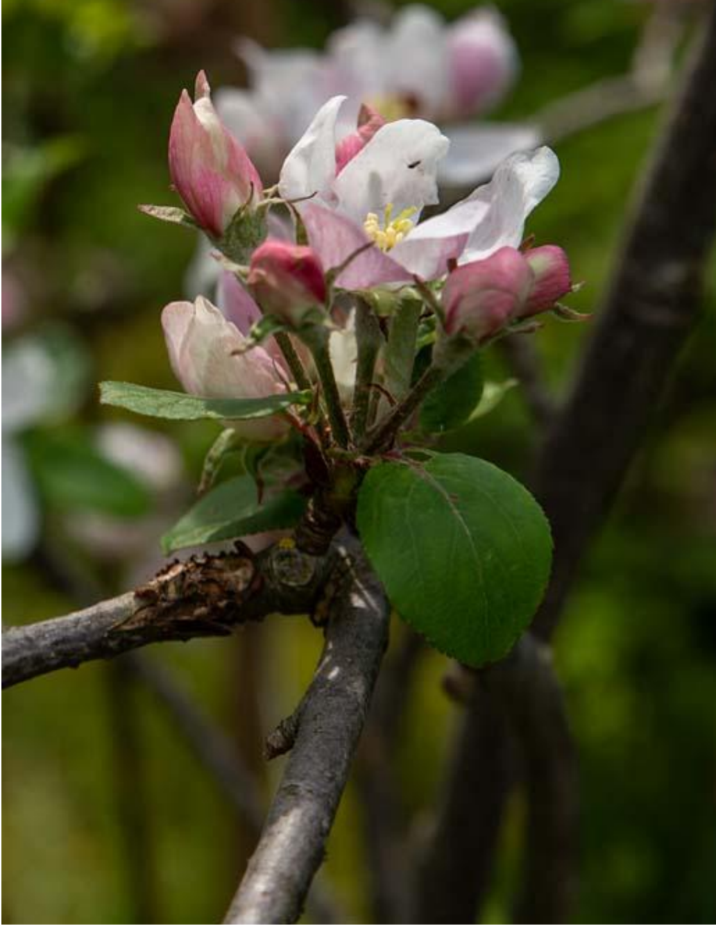
Appel Elstar bloesem