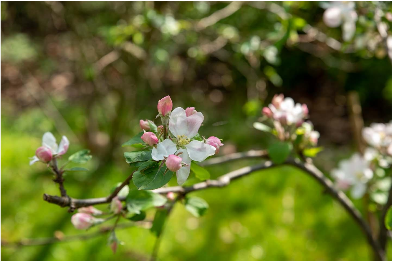
Appel Elstar, bloesem Afbeelding