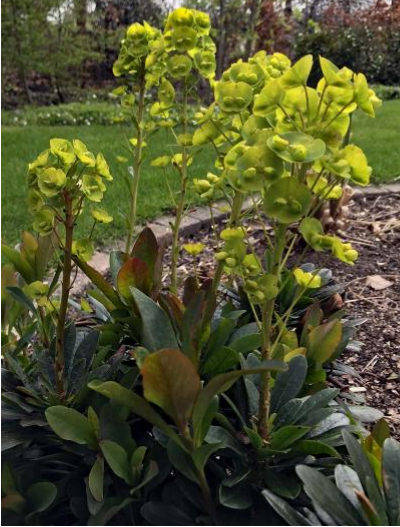
Euphorbia amygdaloides 'robbiae' 2