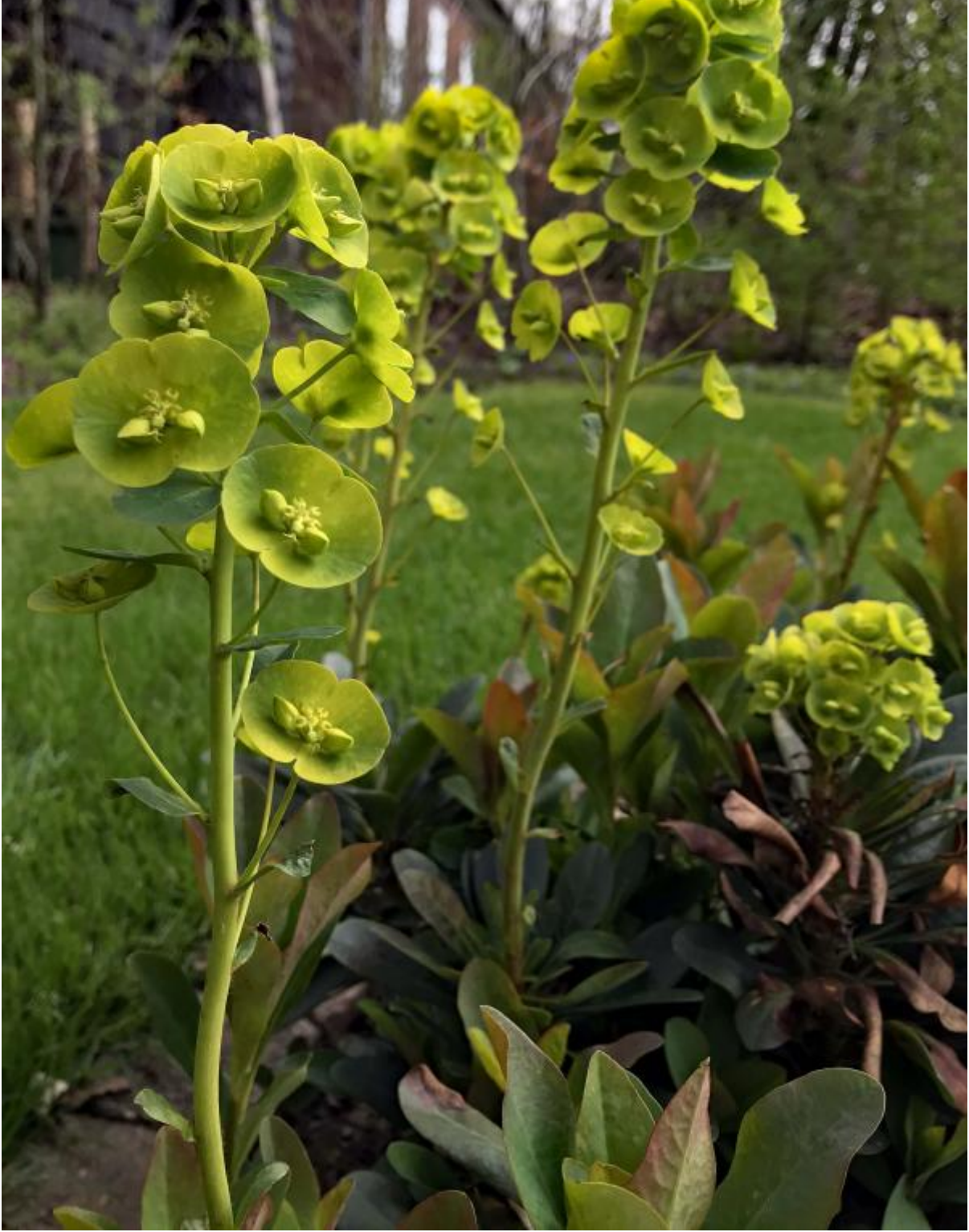
Euphorbia amygdaloides 'robbiae'