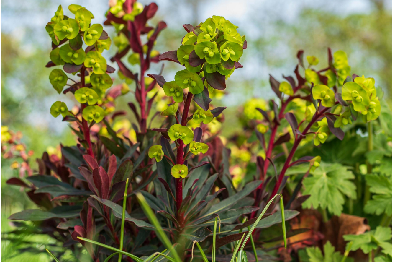
Euphorbia amygdaloides 'Purpurea'